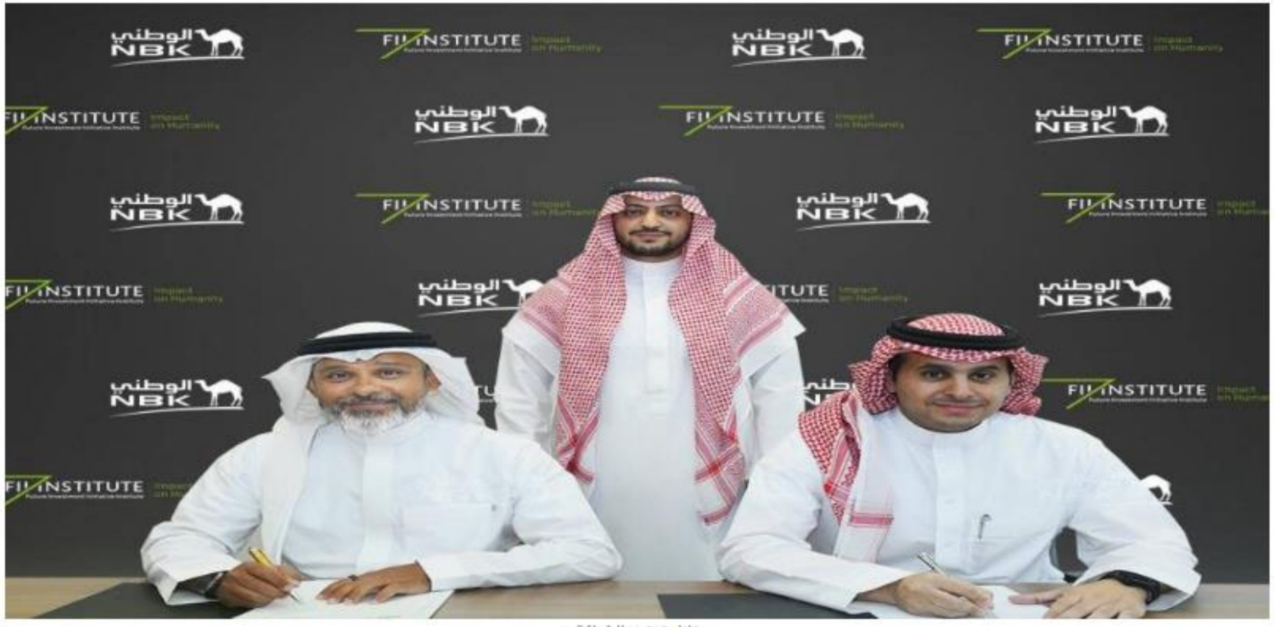
خلال توقيع الشراكة