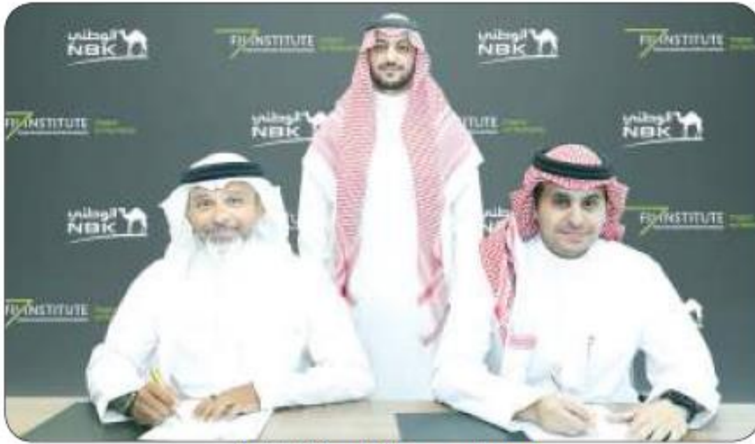
■ جانب من توقيع الاتفاقية

ومن خلال الجمع بين تفوق بنك الكويت الوطني وتميزه المالي والتزام مؤسسة مبادرة مستقبل الاستثمار الراسخ بصياغة المستقبل من خلال مبادراتها العالمية المؤثرة، تمثل هذه الشراكة اتحاداً قوياً للخبرات العريقة والرؤية المشتركة يدعمها