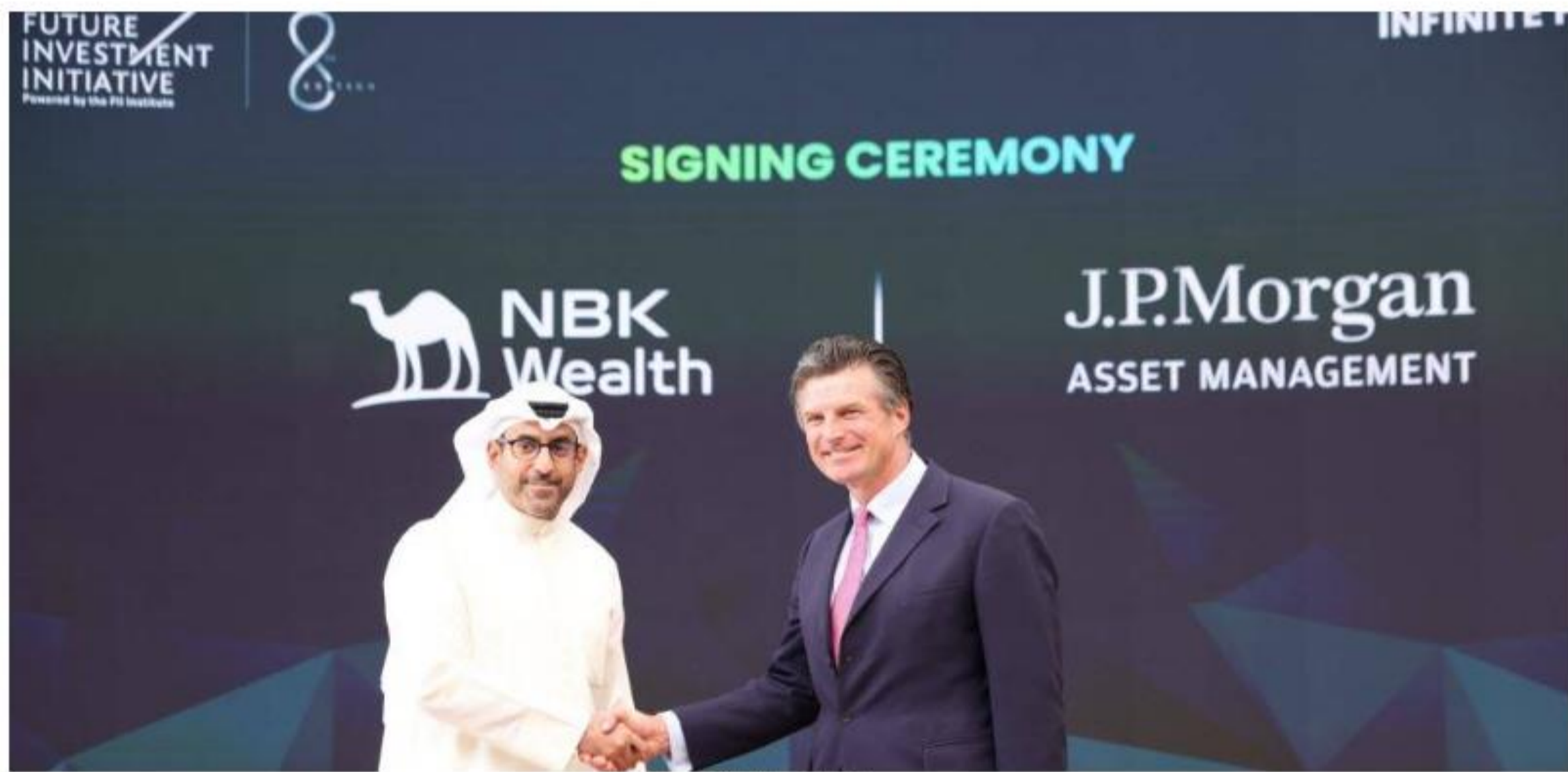
خلال توقيع الشراكة

الوطني للثروات" تُعلن شراكتها مع "جي بي مورجان" خلال "مستقبل الاستثمار"