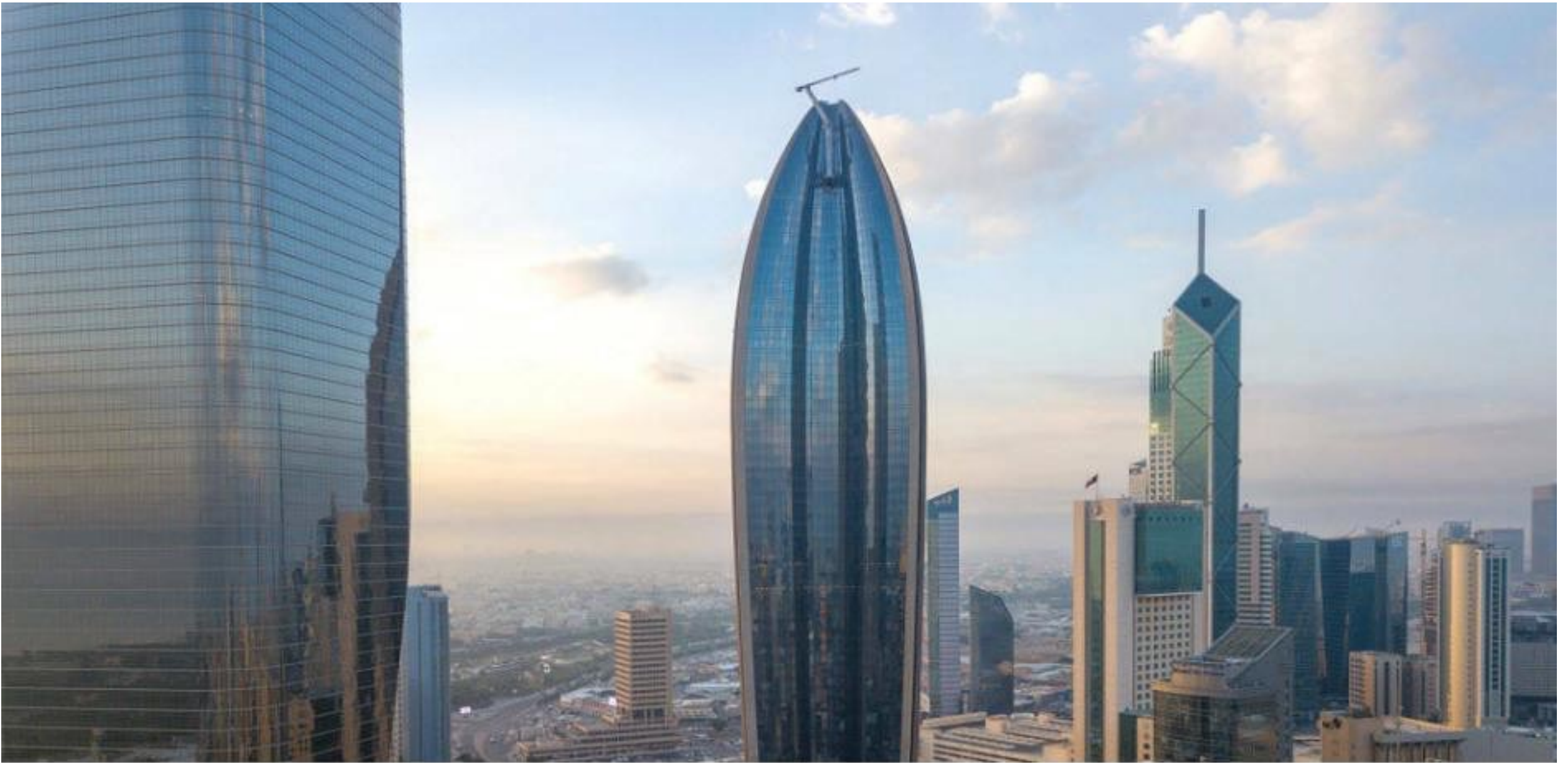
بنك الكويت الوطني

الكويت - مباشر: دشّن بنك الكويت الوطني العلامة التجارية "الوطني للثروات"، وهي إحدى أكبر المجموعات الإقليمية في مجال إدارة الثروات الشاملة.